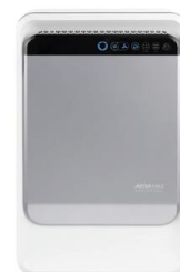
Wandmontage mit Stecker